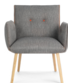
SODA H40 +A