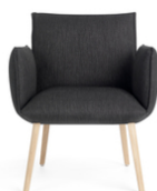
SOFT UNI H40 +A