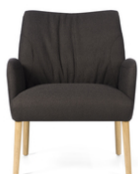
ENORA H40 PB +A