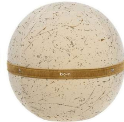
Pierre Frey MajesticNoir & Or